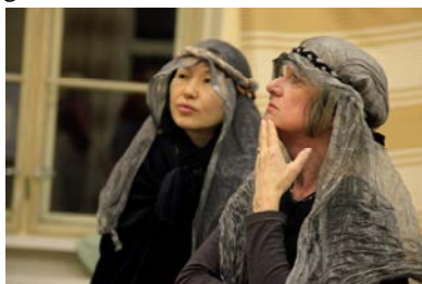
Kommt er noch?