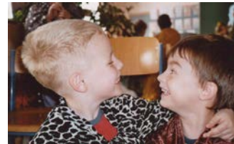
Ein kleines Dingsda zähmt ein Monster.