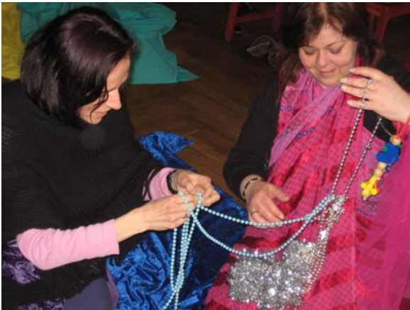
Gemeinsam werden wir den Knoten lösen!