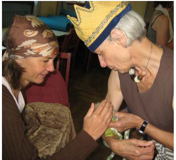
Solange sie klein sind, muss man sie hegen und pflegen!

Beim Spiel stehen das eigene Empfinden und der momentane persönliche Ausdruck der Spielenden im Vordergrund. Die SpielerInnen brauchen nicht zu reden und können ihre Rolle von innen her gestalten. Durch das Weglassen der Sprache entsteht jene Dynamik, durch die sich viele unserer schöpferischen Anteile erst entfalten können. Das Spielgeschehen kann vom dazugehörigen Text, den der/die SpielleiterIn zum Spiel liest, den eigenen Worten der SpielleiterIn, oder von passender Musik begleitet werden.